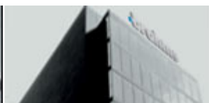
BRAHMS Elettronica Bareggio (MI)