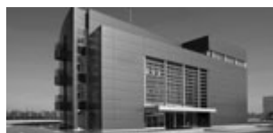
BPT Group headquarter Sesto al Reghena (PN)