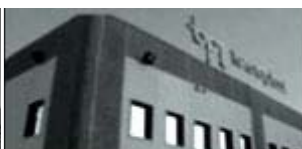
BPT Tecnoplast Villotta (PN)